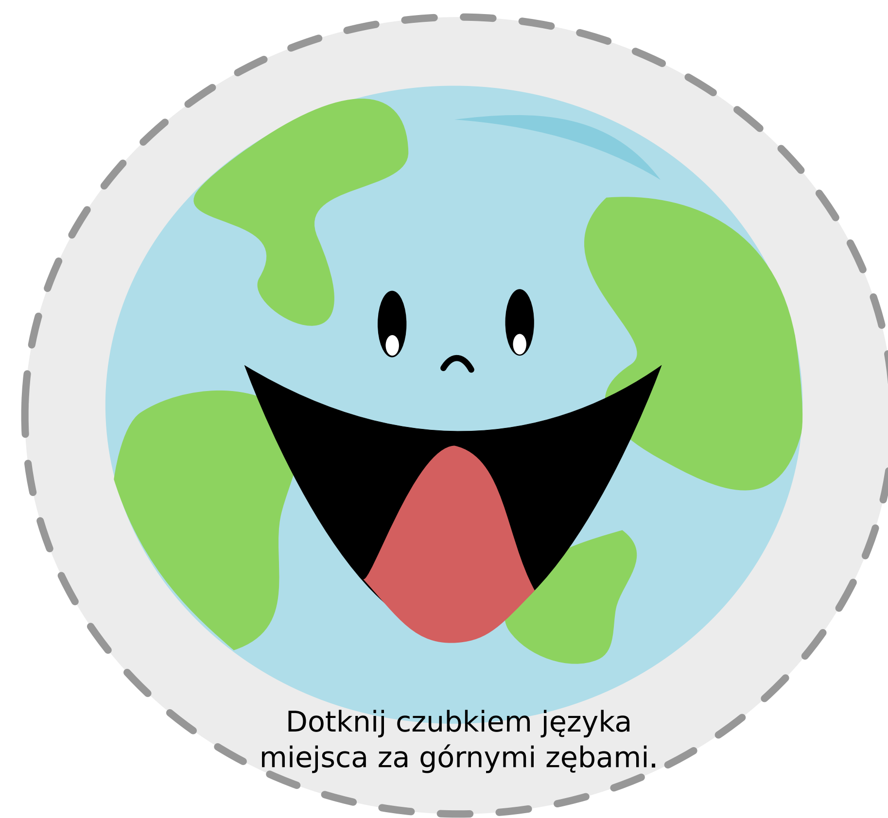
Dotknij czubkiem języka miejsca za górnymi zębami.