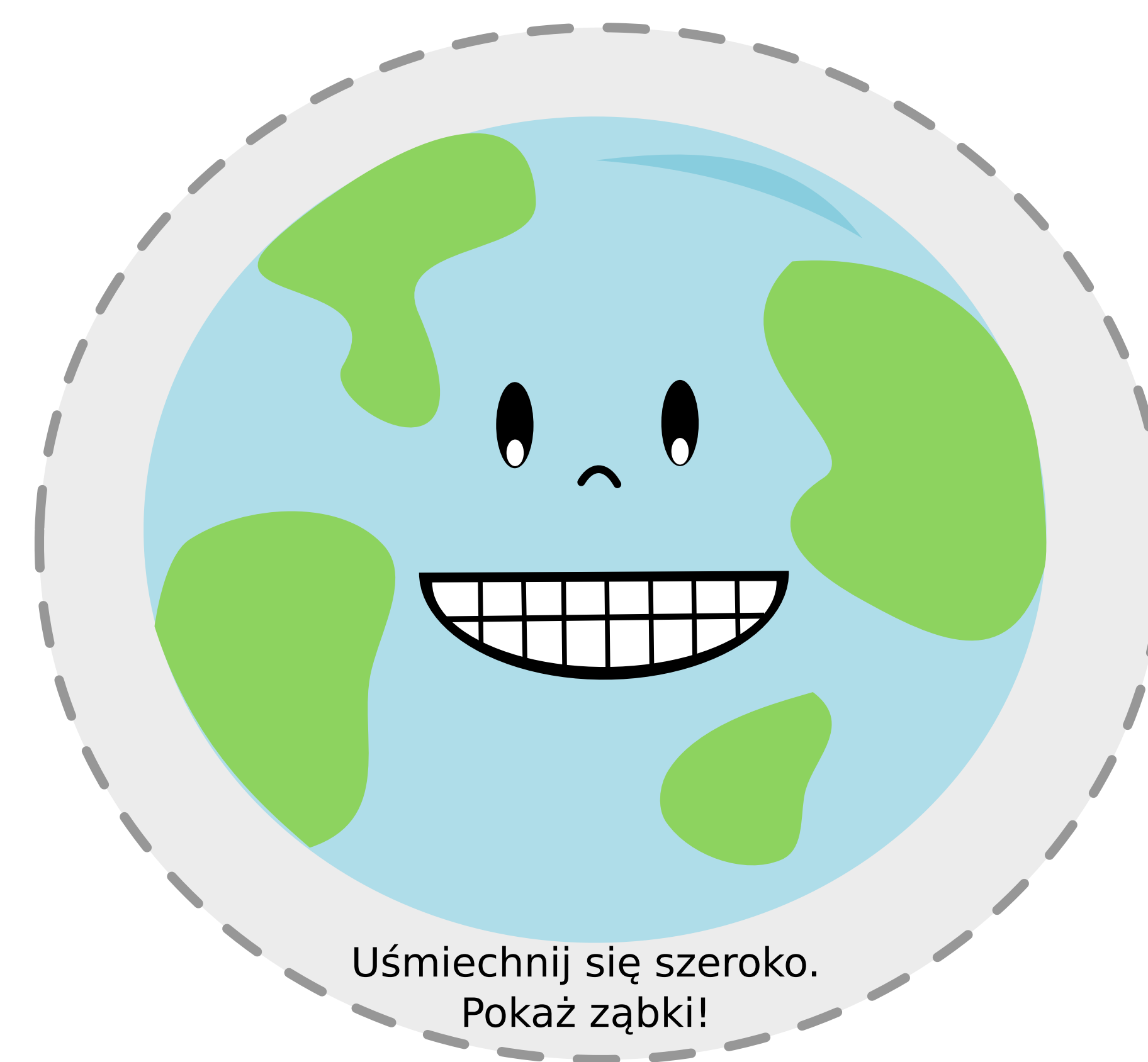
Uśmiechnij się szeroko. Pokaż ząbki!