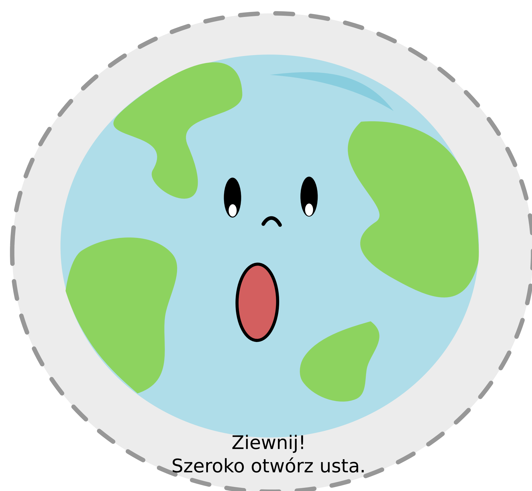
Ziewnij! Szeroko otwórz usta.