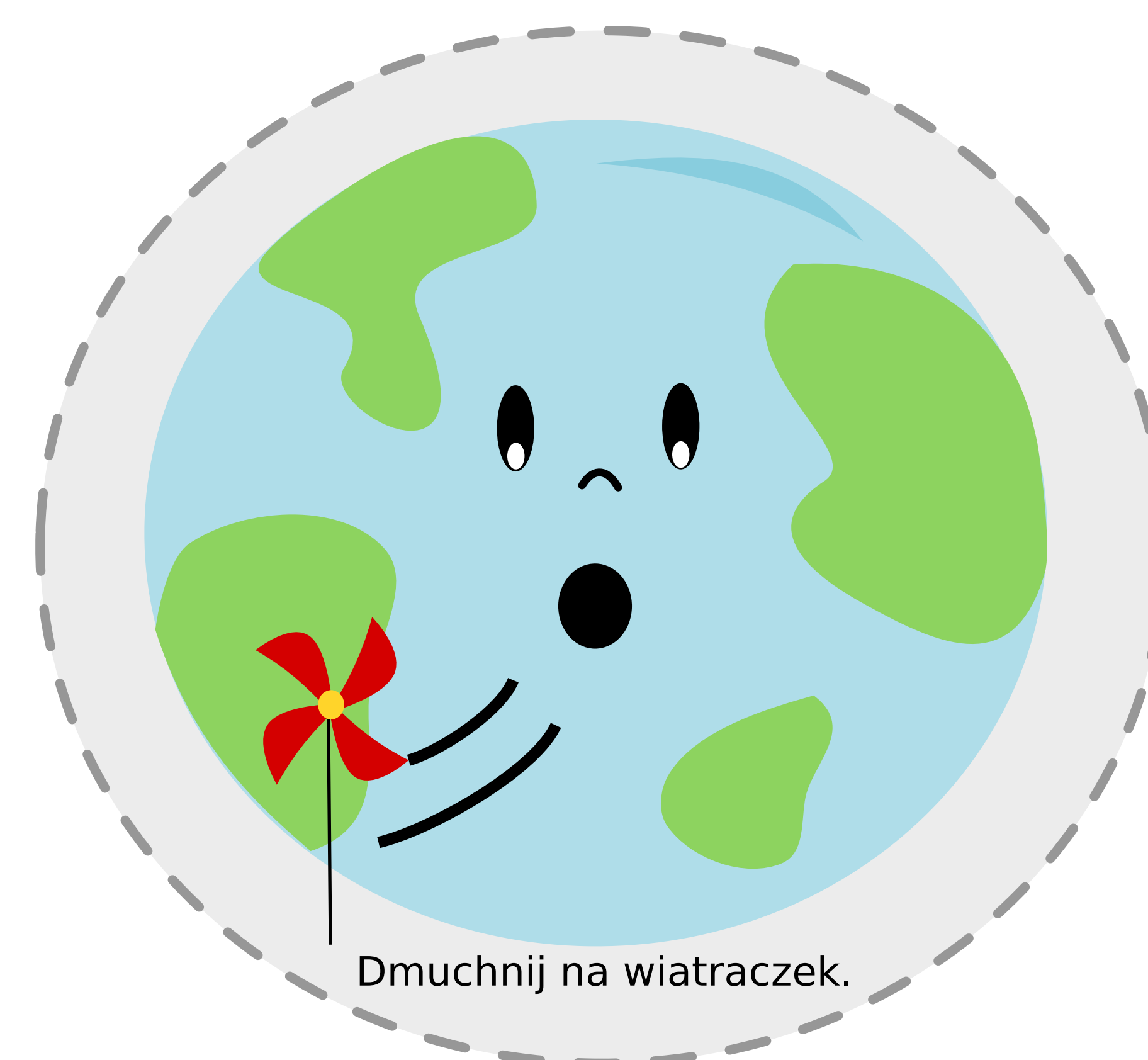
Dmuchnij na wiatraczek.