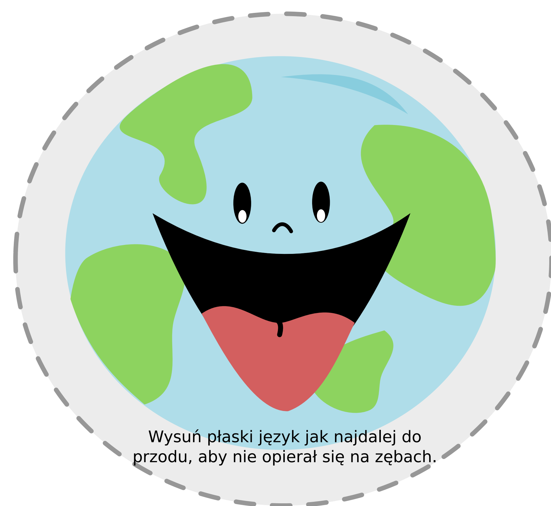
Wysuń płaski język jak najdalej do przodu, aby nie opierał się na zębach.