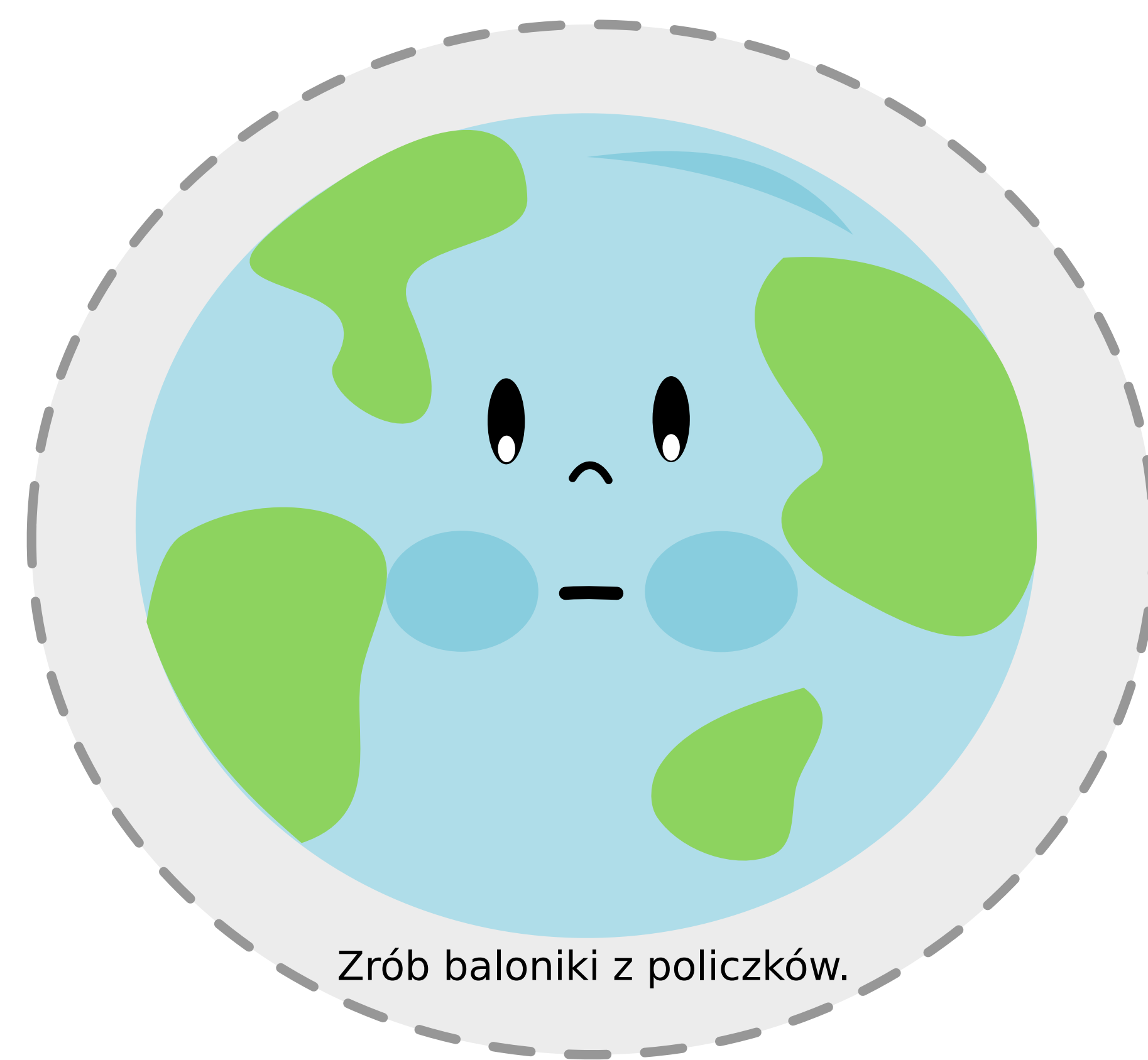
Zrób baloniki z policzków.