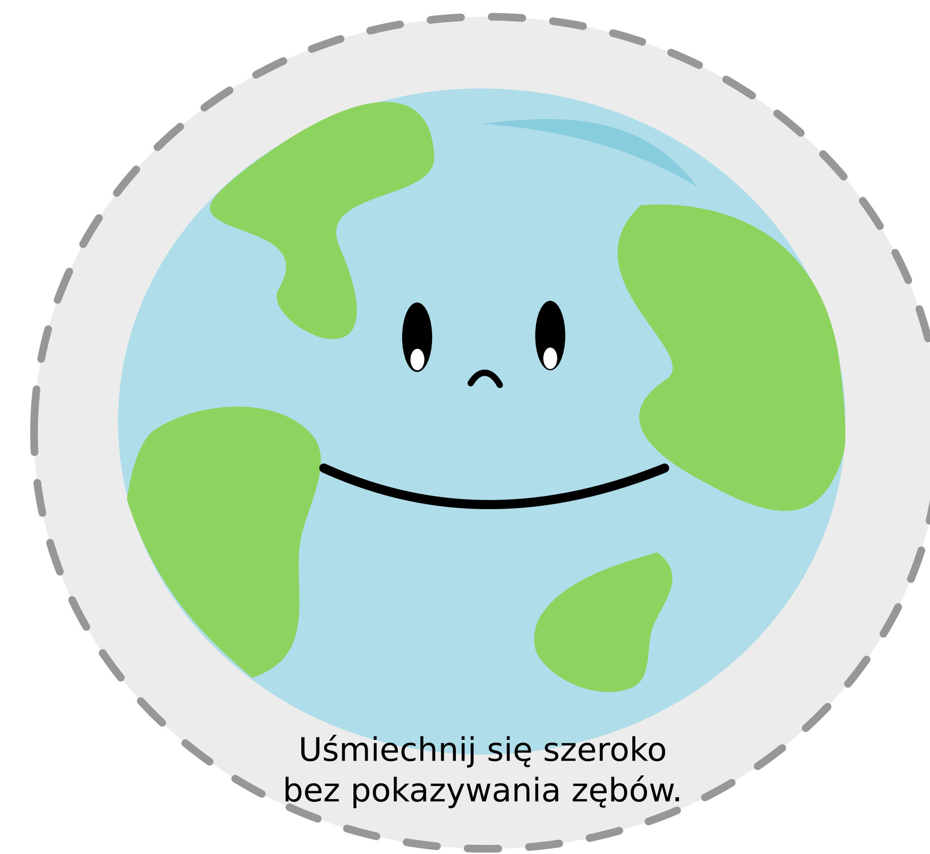
Uśmiechnij się szeroko bez pokazywania zębów.